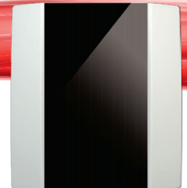
NOVOS 3 SR CO2