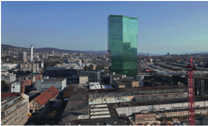
PRIME TOWER ZÜRICH, SCHWEIZ