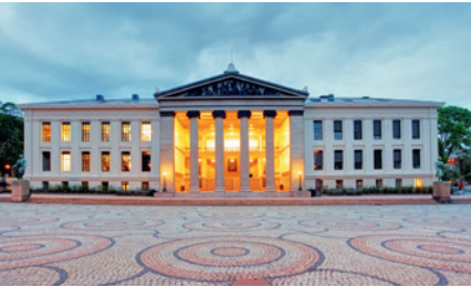
UNIVERSITÄT OSLO OSLO, NORWEGEN