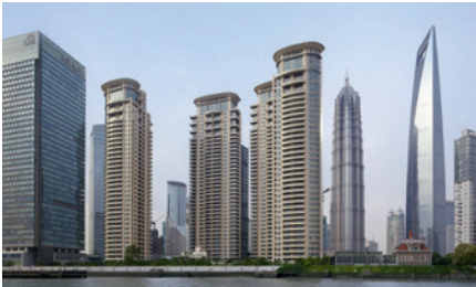
TOMSON RIVIERA APARTMENT TOWERS SHANGHAI, CHINA