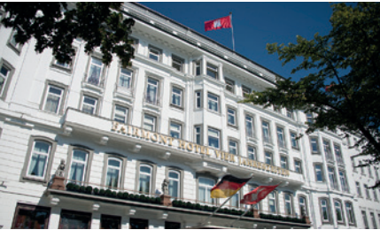
FAIRMONT HOTEL VIER JAHRESZEITEN HAMBURG, DEUTSCHLAND