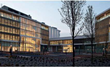
KONICA MINOLTA MAILAND, ITALIEN