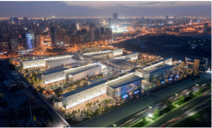
SHEIKH ABDULLAH AL SALEM CULTURAL CENTER, KUWAIT CITY