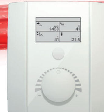
NOVOS 3 x (EPD)