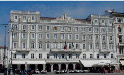
GENERALI VERSICHERUNG, ZENTRALE TRIEST, ITALIEN