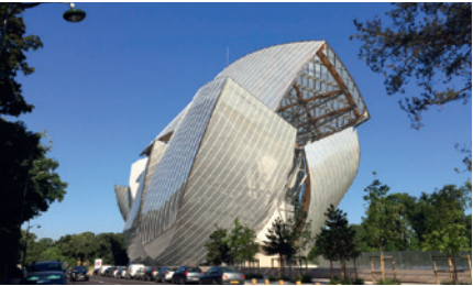
FONDATION LOUIS VUITTON PARIS, FRANKREICH