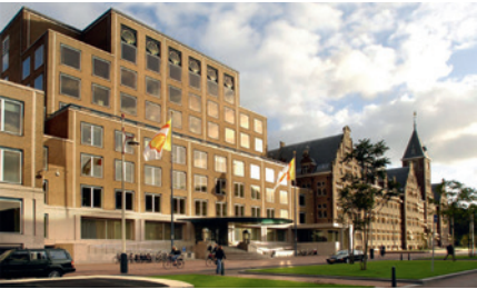
SHELL GLOBAL HEADQUARTERS DEN HAAG, NIEDERLANDE