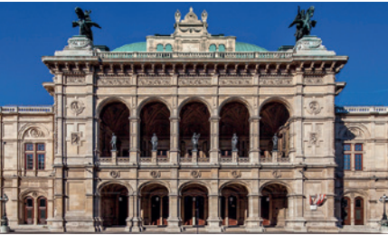
STAATSOOPER WIEN, ÖSTERREICH