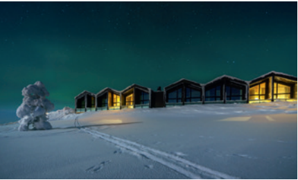
STAR ARCTIC HOTEL SAARISELKÄ, FINNLAND