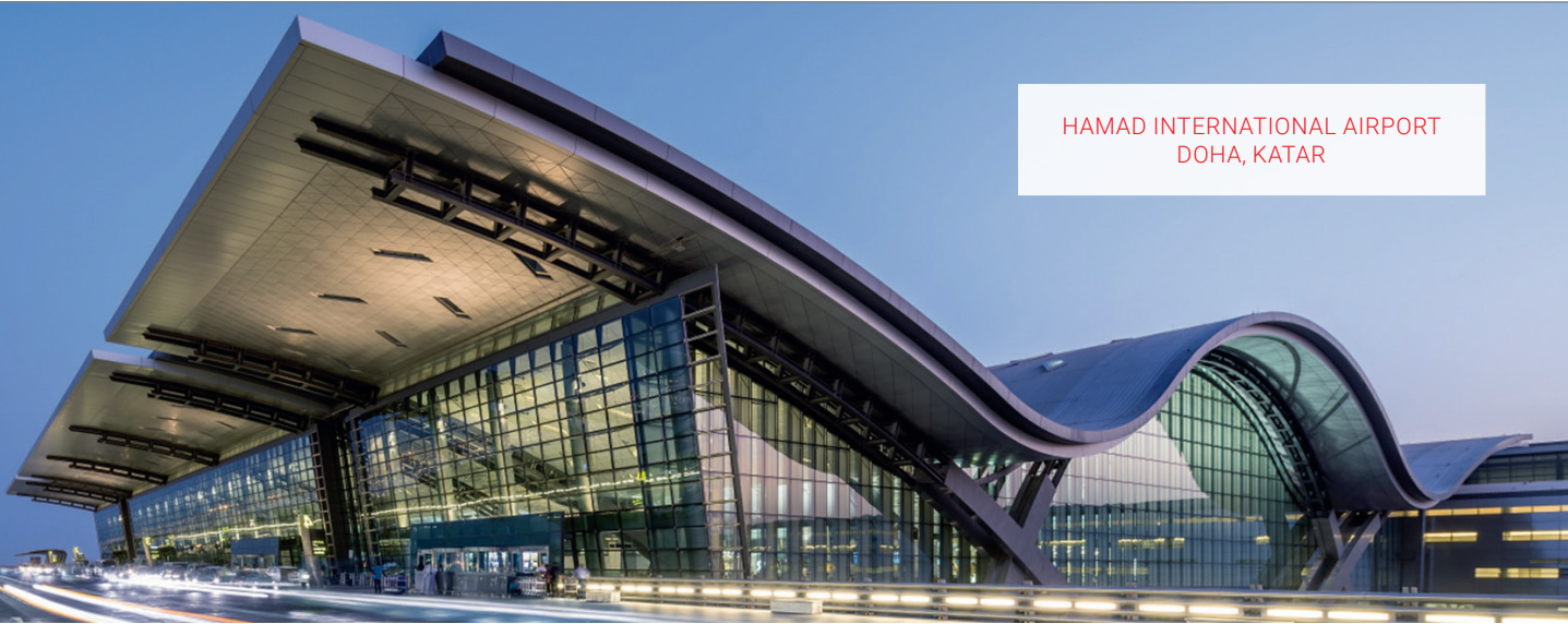
HAMAD INTERNATIONAL AIRPORT DOHA, KATAR