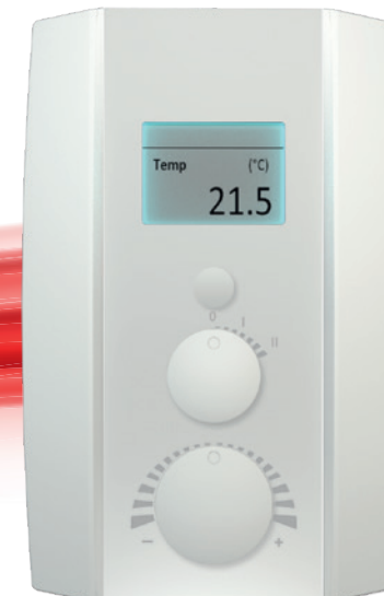
NOVOS 5 x