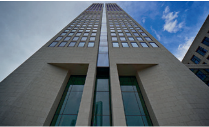
OPERNTURM FRANKFURT, DEUTSCHLAND